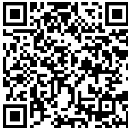
Figura 5. QR para descargar Bemyvega para Android.

https://play.google.com/store/apps/details?id=com.vega.VEGAPLAYER