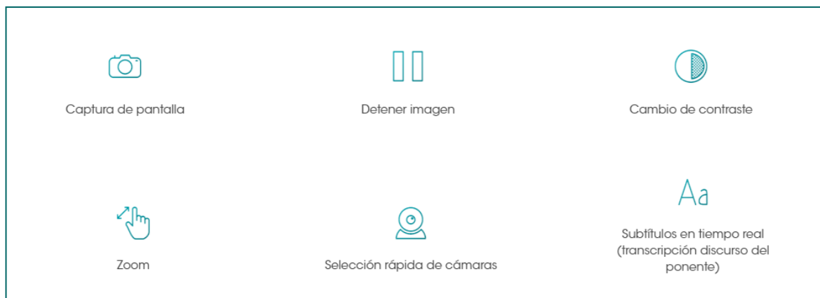
Figura 28. Herramientas de accesibilidad.

La aplicación Vega Player le permitirá mejorar su experiencia gracias a sus herramientas de accesibilidad.