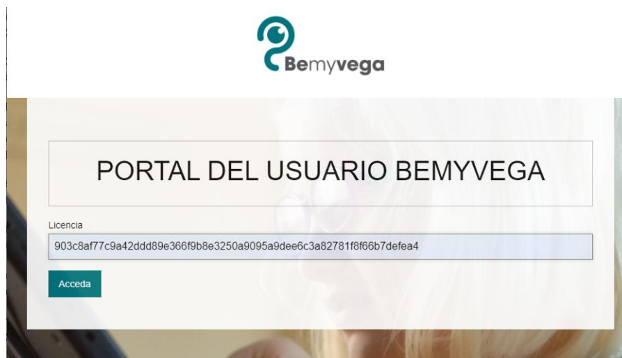
Figura 1. Portal de usuario de Bemyvega.

1.1.2 Introducir la siguiente licencia en el apartado LICENCIA y pulsar el botón ACCEDA: