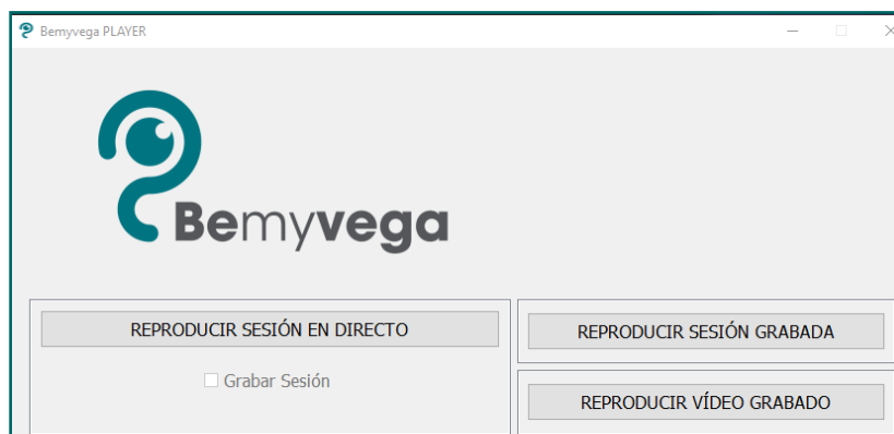
Figura 3 Panel de control Vega Player.

1.2.2 Arrancar Vega Player haciendo doble clic sobre el acceso directo.